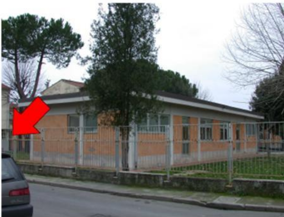
Postazione P2 – Asilo Via M.Bianco

Di seguito sono presentate le singole postazioni mediante documenti fotografici che illustrano i siti originali prescelti per il posizionamento e la successiva installazione delle centraline.